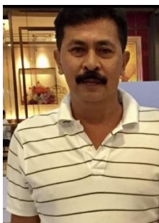
นายมาหะมัดไ้ หะย้อาแหว