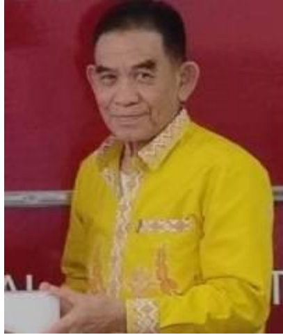
นายสุรินทร์ อีลา (ประธาน กต.ตร.)