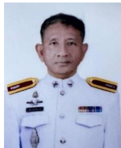
พ.ต.ต.ศราวุธ กิจราช