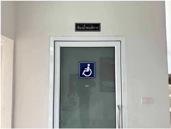
ห้องนํ้าสำหรับผู้พิการ