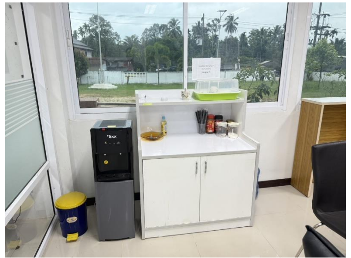
มีน้ำดื่ม กาแฟ ฟรีไวไฟ