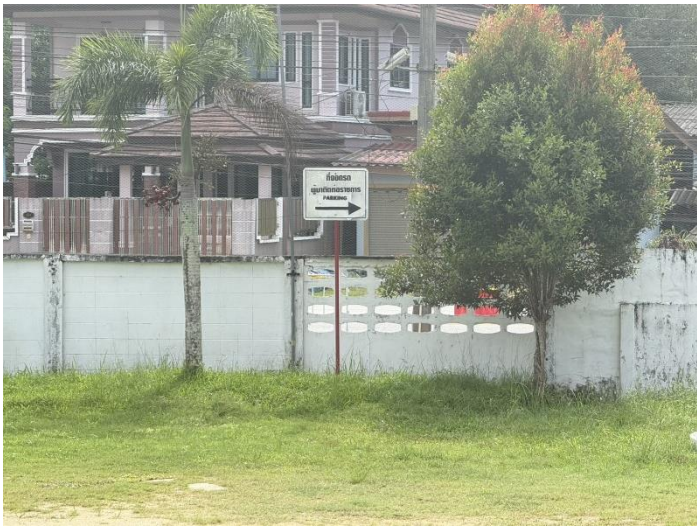
ที่จอดรถสำหรับผู้มาให้บริการ