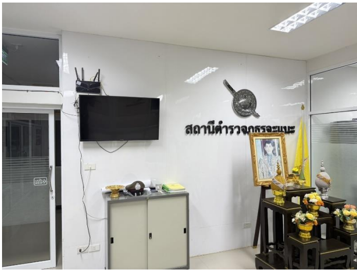
โทรทัศน์สถานีตำรวจแห่งชาติ POLICE TV