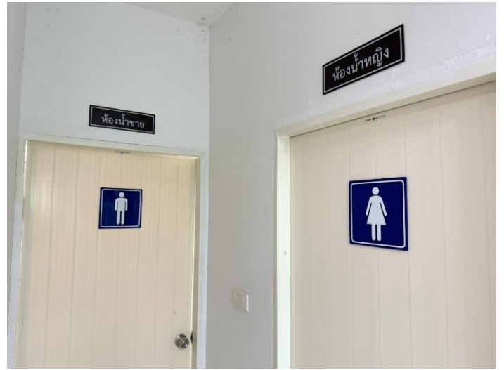
ห้องนํ้าสะอาดแยกชายหญิง