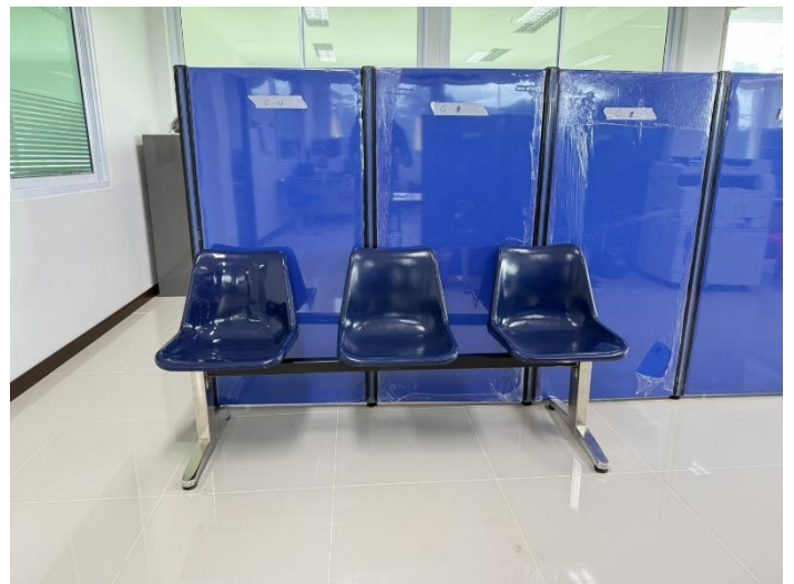
ที่พักรอสำหรับผู้มาใช้บริการ