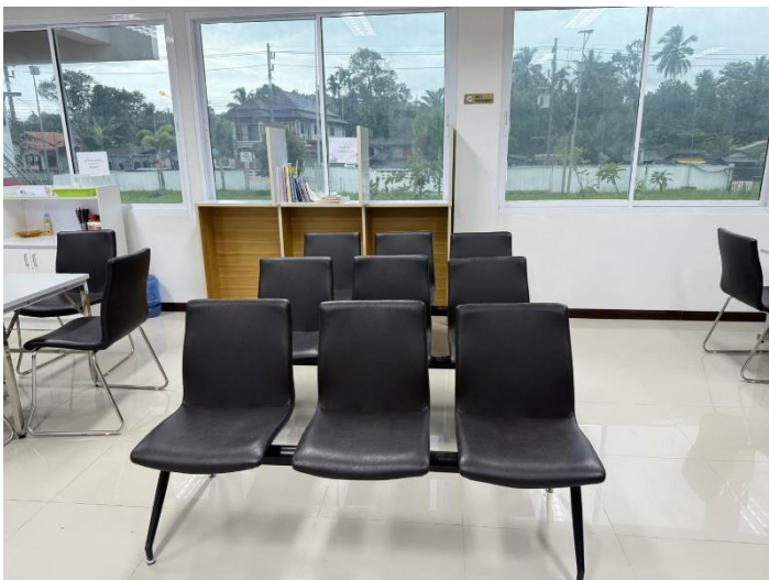
ที่พักรอสำหรับผู้มาใช้บริการ