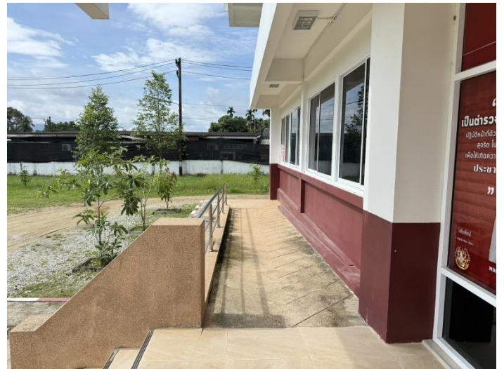
ทางลาดสำหรับผู้พิการ